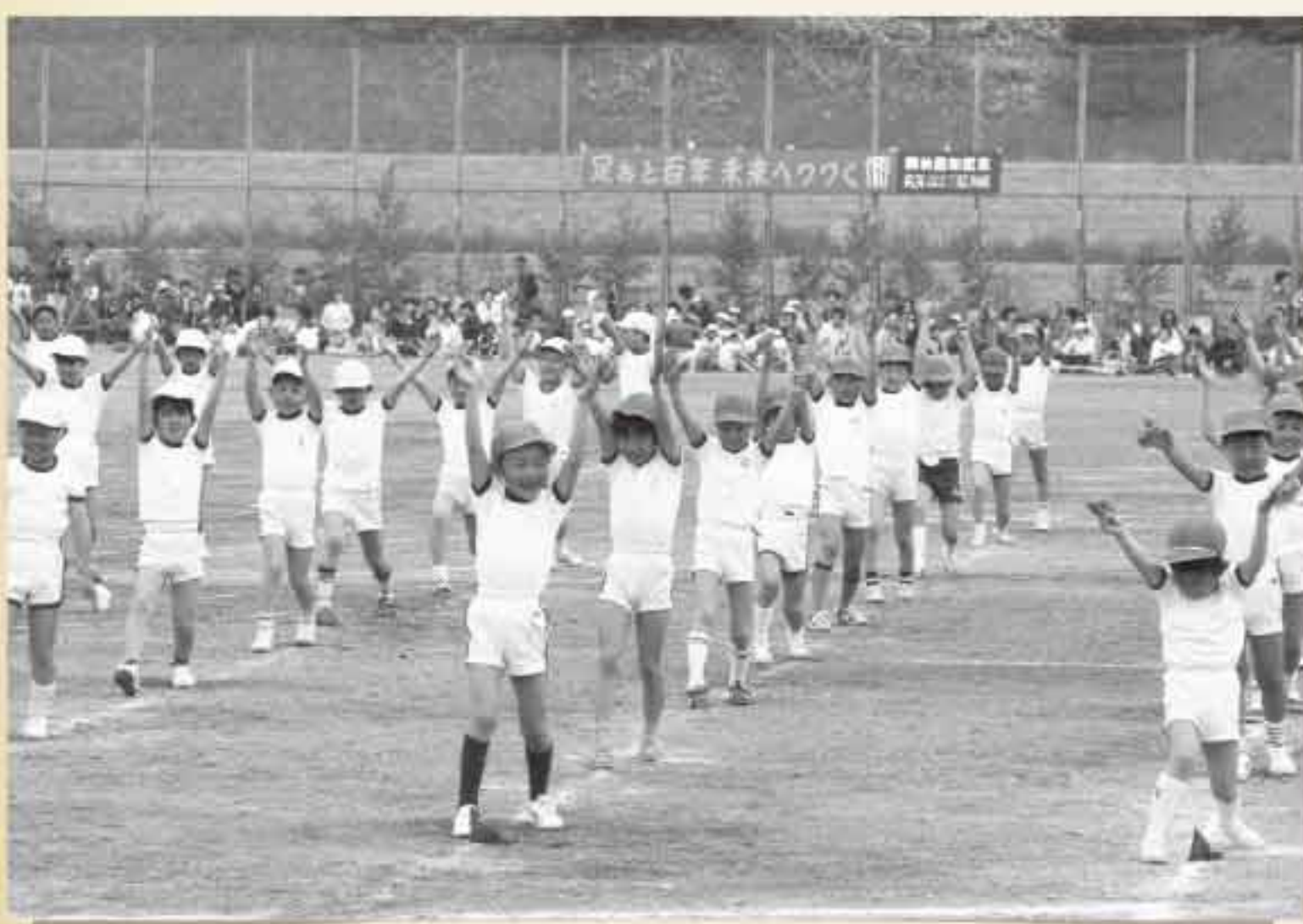
昭和53年 千歳小学校開校100周年 1879年(明治12年)に設立された千歳小学校。この年の運動会の様子。