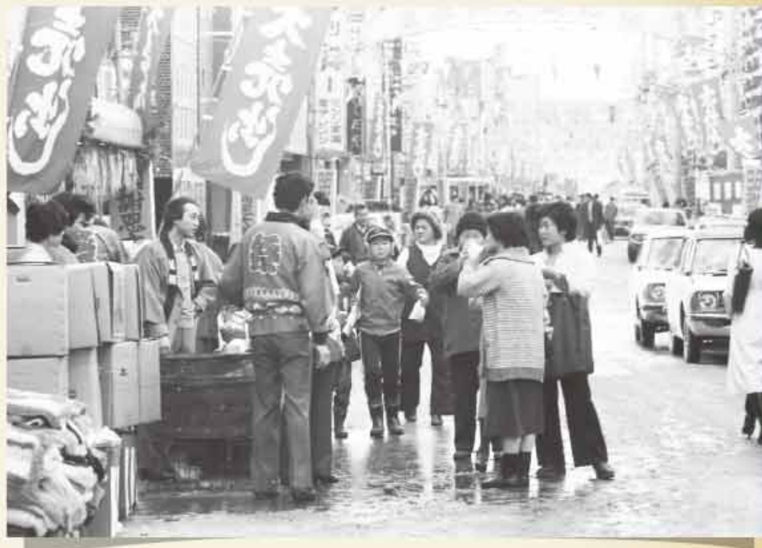
昭和54年 歳末の商店街の賑わい この年にはニューサンロードのアーケードは完成しておらず(昭和55年完成)新川通りの様子と思われる。