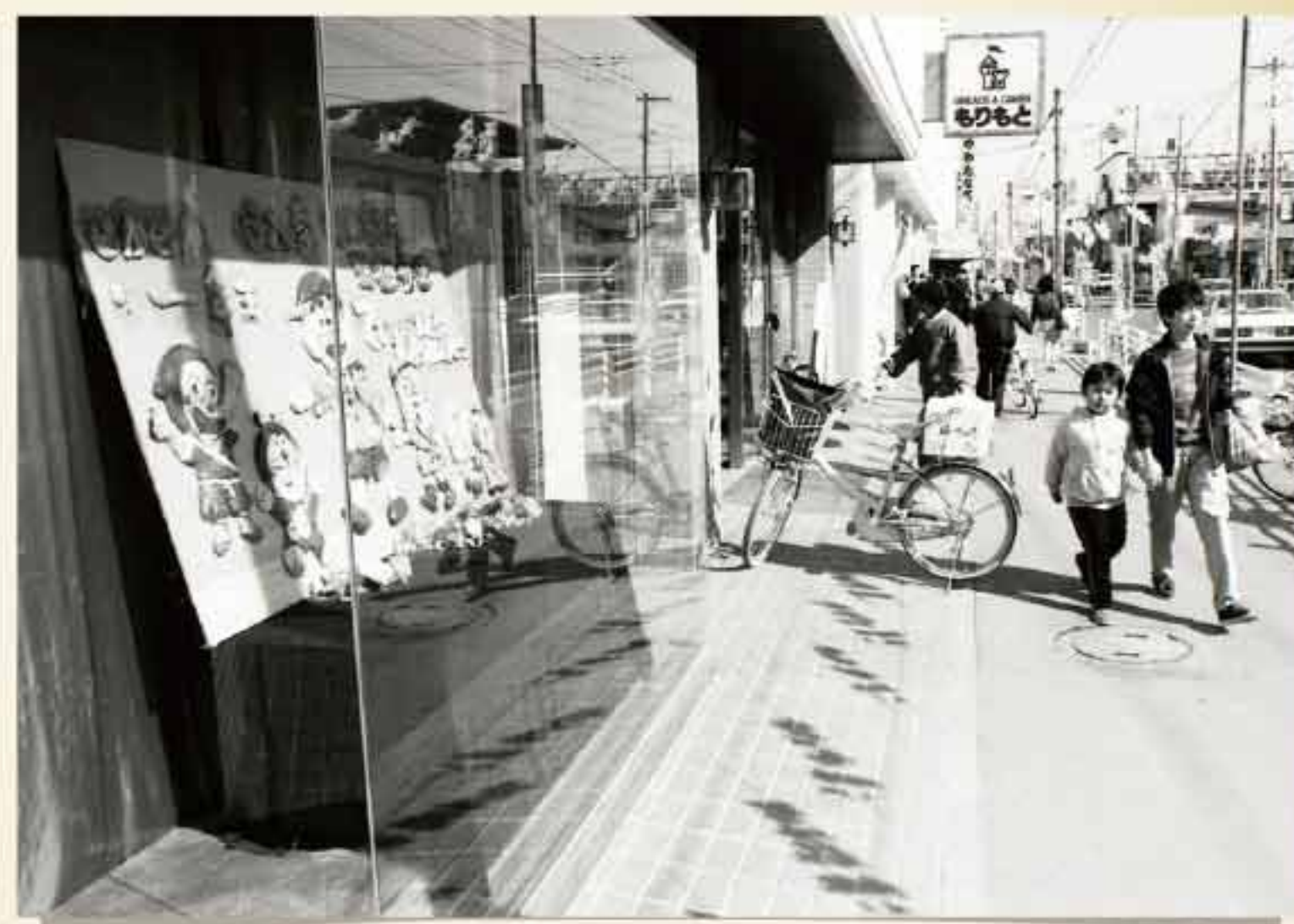
昭和57年 千代田町「もりもと」本店前 大きなショーウィンドーは、今も変わらず市民の目を楽しませている。