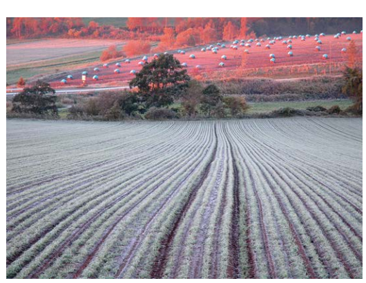
「初霜の頃」 五十嵐 壽秋