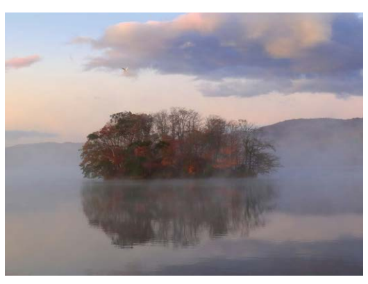
「秋霧の朝」 一戸 雅裕