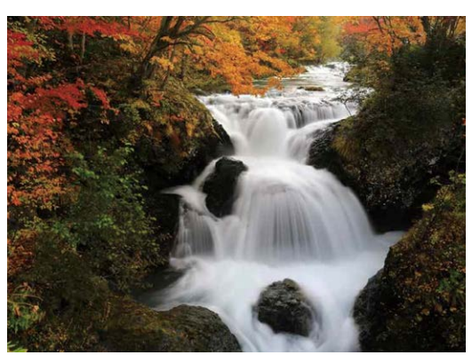
「三段滝」 飛島 博幸