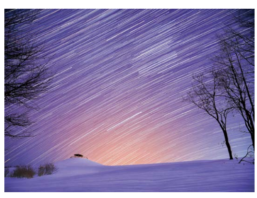
「星奔る丘」 青木 誠