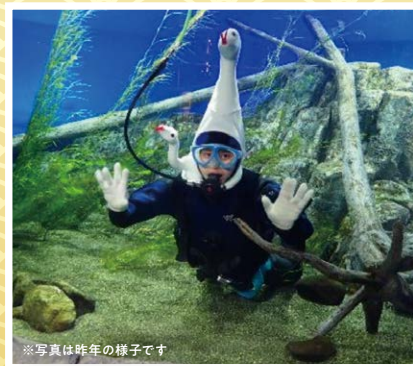
※写真は昨年の様子です

日時: ①令和7年12月28日(日) 11:00~30分程度 ヘビダイバー登場 ②令和8年1月2日(金) 11:00~30分程度 ウマダイバー登場 場所: 支笏湖ゾーン 参加: 無料(入館料別途必要)