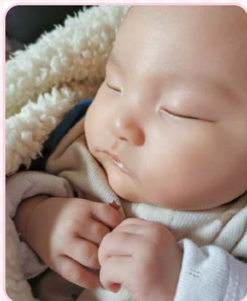
ののはちゃん 千歳市住吉町 よっけさん

※掲載の時期、可否については一切お答えできません。 ※兄弟姉妹はなるべく「集合写真」でお送りください。集合写真は横向きでもOK！投稿前にお友だちに掲載の許可をとってからお送りください。※性別年齢問わず、衣服を着用した画像をお送りください。(お風呂で撮影したもの、下着姿、水着姿などは掲載不可、またはトリミングしての掲載となる場合があります。) ※過去1カ月以内に掲載された投稿者のご応募はお控えください。