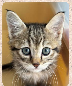
そよかちゃん 千歳市長都駅前 ともにゃんさん

生ビール ¥190(税別) (税込209円) ハイボール ¥80(税別) (税込88円) ※1,000円以上、お食事いただいたお客様のみご利用いただけます。