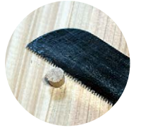
▲木製ダボ継ぎ加工

【何千年も使われている物・・・桶】日本の桶(おけ)は、スギやヒノキなどの薄板を円筒状に並べ、竹や銅のタガで締めた木製の容器で、現役で味噌・醤油の醸造、寿司桶やお櫃(おひつ)としても多用途に活躍しています。その歴史は世界的にも古く、聖書にも記録があります。今から2000年以上前、イエス・キリストが生まれた時に入れられていたのが何と『飼い葉桶(かいばおけ)』だったのです。年末になるとにわかに話題になります。現代でも飼い葉桶は馬や牛の飼料用として使われています。使い勝手の良いものは何千年経っても残されるんですね。