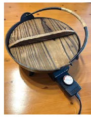
▲お気に入りの『卓上電気鍋』。蓋はもちろん檜です。

子供の頃、自宅店舗の厨房拡張工事に伴い、お気に入りだったタイル張りの五右衛門風呂が撤去されてしまいました。その後、隣りの建具屋さんから度々「もらい風呂」をすることになりますが、その風呂というのは、当時としては一般的なのですが、我が家とはまったく違う『檜(ひのき)の桶風呂(おけぶろ)』だったのです。湯が沸いた頃に、大きな檜の蓋を開けると、浴室に湯気と檜の香りが一気に広がるのが印象深かったです。夕食で寄せ鍋をした時に『檜の鍋蓋』を開けた瞬間、檜の香りと共に昔の記憶が甦ってきました。