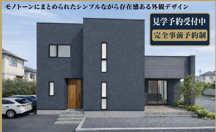
モノトーンにまとめられたシンプルながら存在感ある外観デザイン