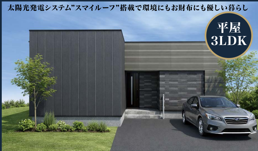
太陽光発電システム「スマイルーフ」搭載で環境にもお財布にも優しい暮らし