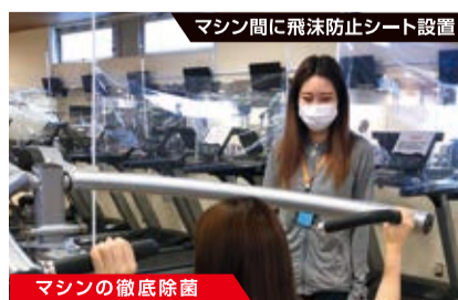
マシンの徹底除菌