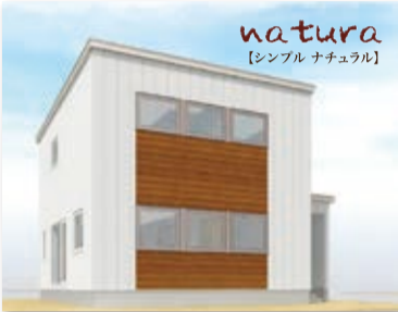
natura [シンプル ナチュラル]