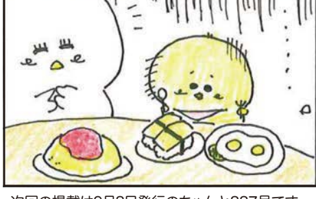
次回の掲載は9月8日発行のちゃんと887号です。お楽しみに!!

ズを中心に心と体をリフレッシュ!運動不足解消したい方、初心者大歓迎。気軽に見学、体験お待ちしております。