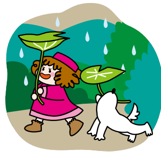
イラスト/ステファニー・ナナ

方のHPでアイヌ語の紹介があったり、基本的な単語はわかりやすい。ネット情報は正確さに問題もあるので必ず後でアーカイブでチェックしてほしいのですが、先日うっかり千歳で伝承されている「カンナカムイ」(雷神が物語る神話)をアーカイブではなく検索窓で調べました。「え？なんでこんなにヒットするの!？」とびっくり。しかし私がイメージするカンナカムイ(雷神は竜の姿をすると伝承されています)ではなくアニメ絵の女の子(「マツカチ」ばかり。調べると漫画『小林さんちのメイドラゴン』(作・クール教信者)の登場人物の名前がカンナカムイとのこと。竜「ドラゴ