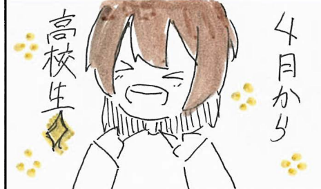
今回の掲載は5月3日発行のちゃんと920号です。お楽しみに!!

対象 / 0歳～小学生(未就学児は保護者同伴) 参加費 / 1人につき100円 持ち物 / 汚れてもいい服装 定員 / 1枠15人まで(全5枠) 申込期間 / 4月20日(土)まで 問合せ・電話 / 39-2232(まちスポ恵み野) 申込 / まちスポ恵み野 Instagram (@machispomegumino) に掲載の申込フォーム URL からお申し付けください。