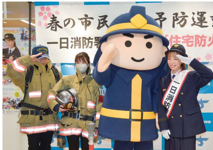
▲消防服を着て記念撮影