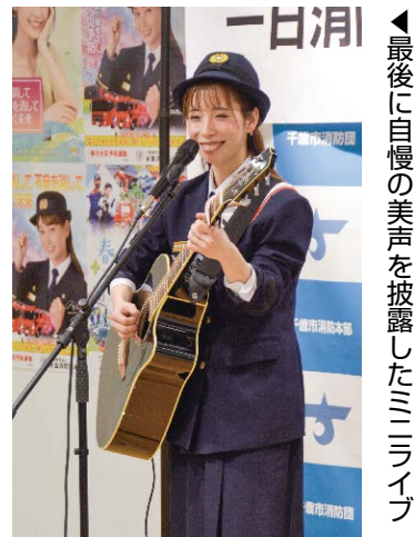
▲最後に自慢の美声を披露したミニライブ