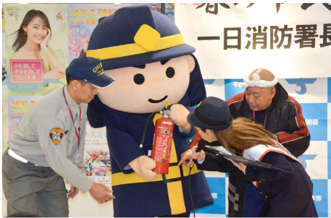
▲消火器の使い方をレクチャー