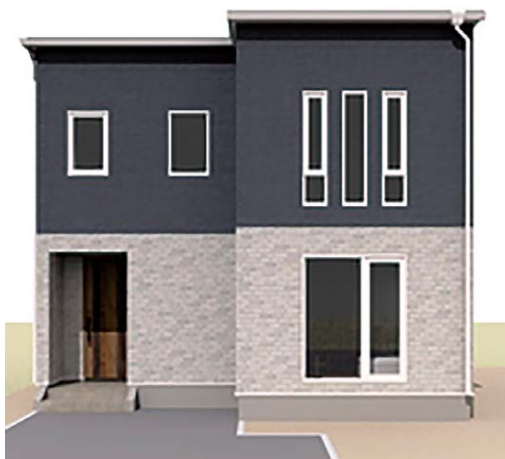
完成予想図/図面を基に描き起こしたもので、実際とは多少異なります。