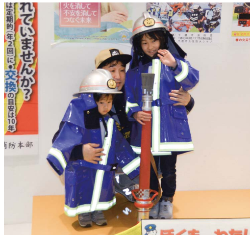
▲お父さんと子どもたちで「ハイ、チーズ！」