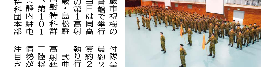
陸自第1高射特科団 創隊52周年 記念式典・装備品展示など挙行

北海道の防空を主任務とする陸上自衛隊北方面隊直轄の防空部隊「第1高射特科団」(団本部・東千歳駐屯地)の創隊52周年記念式典が