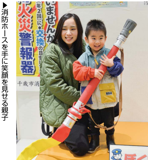
▶消防ホースを手に笑顔を見せる親子