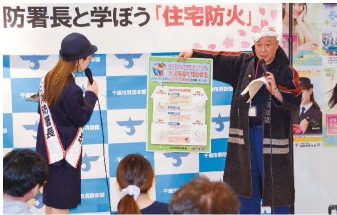
▲住宅用火災警報器の設置を呼びかけ