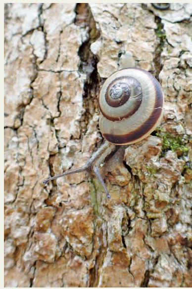
雨降り後、殻から体を出して活動開始。触覚の先端に目がありますね。

皆さんも近くの林でカタツムリを探してみませんか。実は、支笏湖ビジターセンターではサッポロマイマイを飼育・展示しています。どうぞ会いに来てみてください。