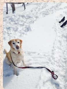
ナイトちゃん 千歳市東雲町 Labradorさん