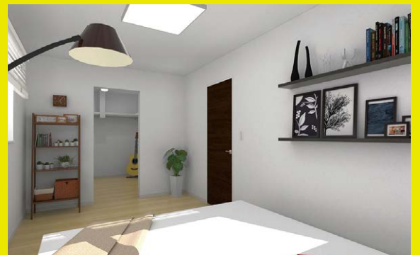
布団や行楽用品も片付く4.5帖のクローゼット