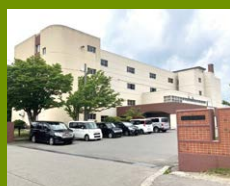
北斗中学校 徒歩4分 小中連携・一貫教育に取り組む中学校。創立41年の比較的新しい学校です。