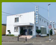
北斗内科・小児科 徒歩7分 北斗の頼れる地元の病院です。