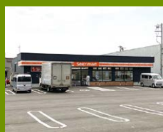
セイコーマート 徒歩7分 昨年末OPENした新しいコンビニ。駐車場がとても大きくいつも賑わっています。