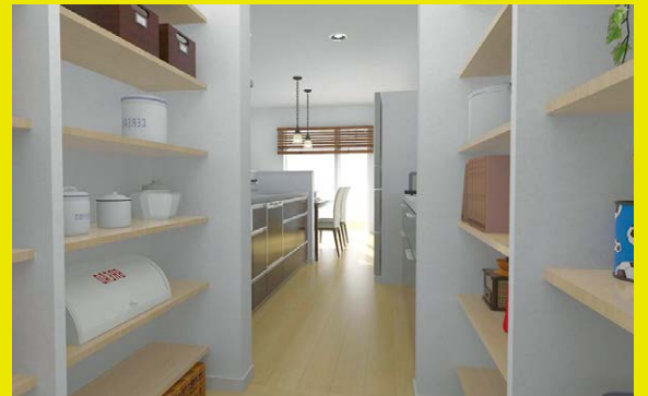
使わない調理器具等はきちんと隠せて さっと出せるパントリーへ