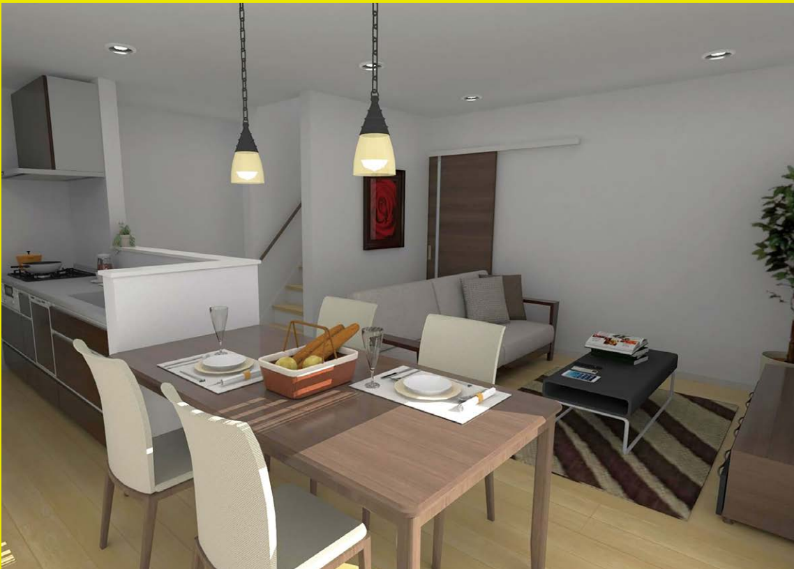
回遊動線の中は、家族が毎日顔を合わせられる リビング階段