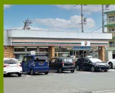
セブンイレブン 徒歩6分 昔からずっとここにある地域に根付いたお店。すぐ近くには郵便局もあります。