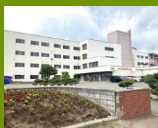
桜木小学校 徒歩13分 自然に囲まれたオープンな小学校。HPでは授業の様子などを、ほぼ毎日ブログにアップしています。