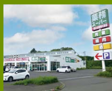
業務スーパー 徒歩13分 みんなが楽しい業務スーパーに歩いて行けます。