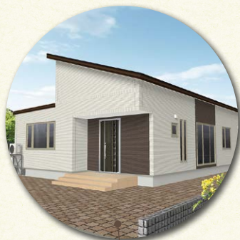
緑苑台宿泊棟 石狩市・33坪・平家