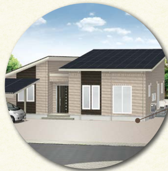
厚真宿泊棟 厚真町・36坪・平家