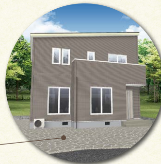
北26条(アイスマート) 札幌市・30坪・2階建