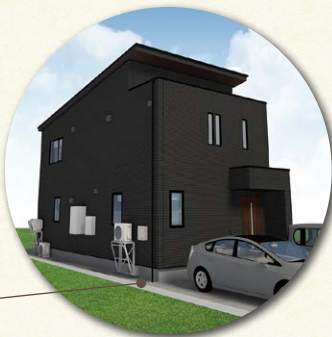
北26条(グランスマート) 札幌市・30坪・2階建