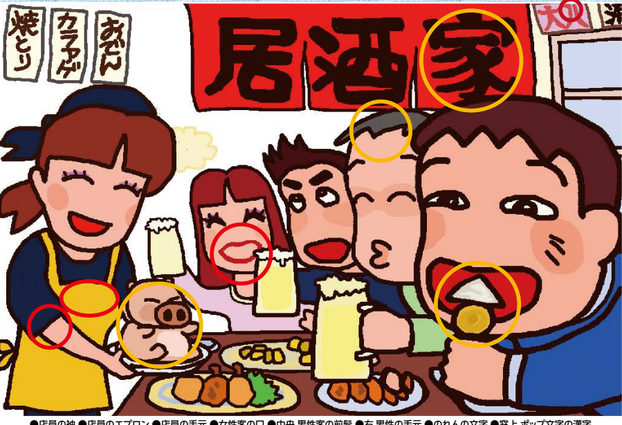
●店員の袖 ●店員のエプロン ●店員の手元 ●女性客の口 ●中央 男性客の前髪 ●右 男性の手元 ●のれんの文字 ●窓上 ポップ文字の漢字