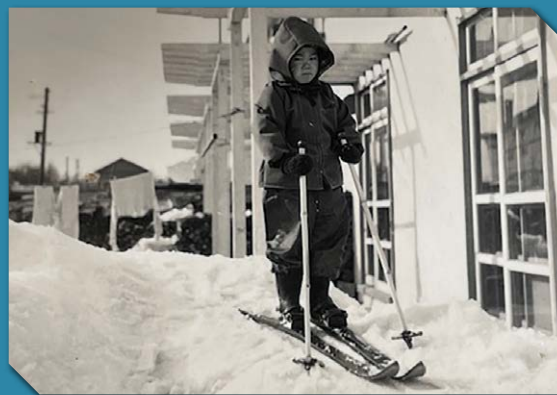
千歳町営住宅 / 昭和34年撮影