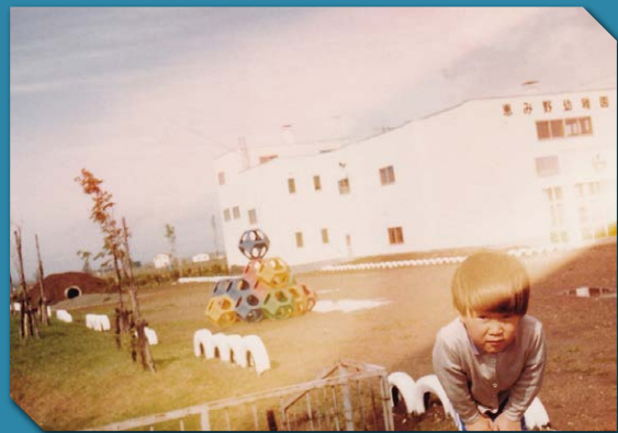
玉置様提供 / 恵み野幼稚園 / 昭和58年撮影