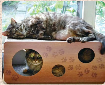
ジタンちゃん&バニラちゃん 千歳市寿 にゃんズのママさん