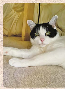
にゃんちゅうちゃん 千歳市清流 ハチワレさん