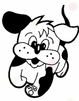
マスコットキャラクター「スマイリー」

社会福祉法人恵庭市社会福祉協議会 恵庭市末広町124 電話 33-9436、32-0007