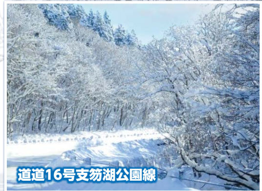
道道16号支笏湖公園線

川の側は湿度が高く、霧氷が発生しやすい環境です。千歳市街から支笏湖へと続く道道16号は、千歳川と並走しているため湿度が高く、圧巻の霧氷ロードとなります。気温が上がると溶けてしまいますので、早起きして見に行ってみましょう!