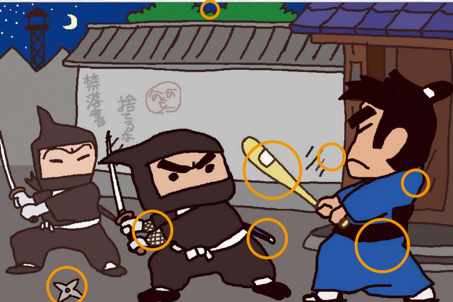
●手裏剣の位置 ●中央忍者 袖の模様 ●中央忍者 袴(さや)の長さ ●浪人の手元 ●浪人の袴(さや) ●浪人の着物の模様 ●影の落書き ●中央上の星