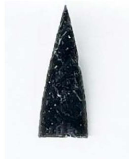
▲ イヨマイ6遺跡の美しい石鏃

今回お手本にした石鏃は、当センターで絶賛開催中(～4/13まで)の企画展「あなたのそばの遺跡たち 千歳市内の遺跡紹介」でご覧いただけます。この機会にぜひ、大昔の人々の技術に思いを馳せてみてください。