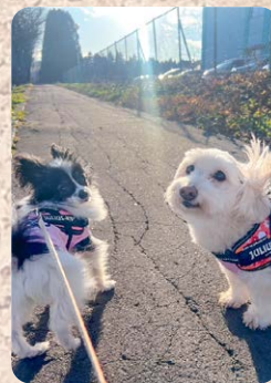
マリンちゃん&あんちゃん 千歳市北陽 あんマリンママさん