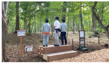
▲ 手作り見学路Part2 (ちょっとだけ低い初代展望台)