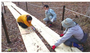
▲ 手作り見学路Part1(あゆみ板の高さ調整に大苦戦)