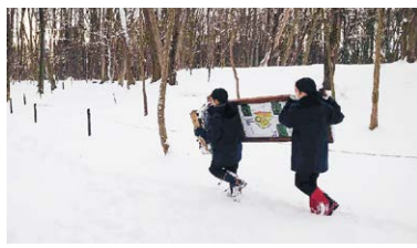
▲ 毎年恒例だった現地看板の撤去

それでは、キウス周堤墓群ガイダンスセンター、オープンです! おめでとうございます!