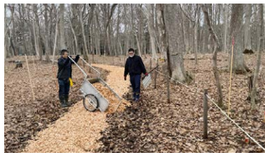
▲ 手作り見学路Part3 (最後のウッドチップ敷き、R7年4月)